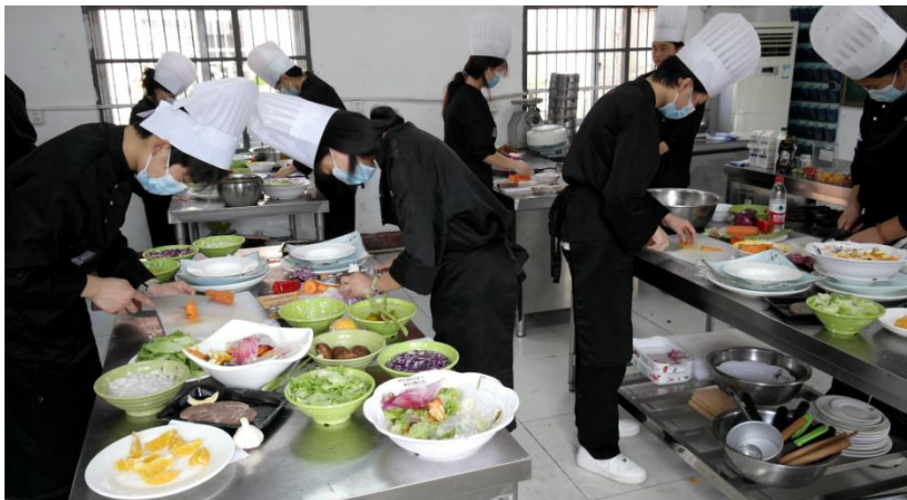
图 3：中西餐烹饪比赛现场

中西餐烹饪等 29 个赛项，吸引 323 名学生参加比赛。竞赛的成功举办，探索技能大赛对人才培养模式改革的引领促进作用，增强学生就业创业综合竞争力，助推竞赛成果有效转化，以此培养更多高素质技能人才，在深化产教融合上实现新的更大突破。